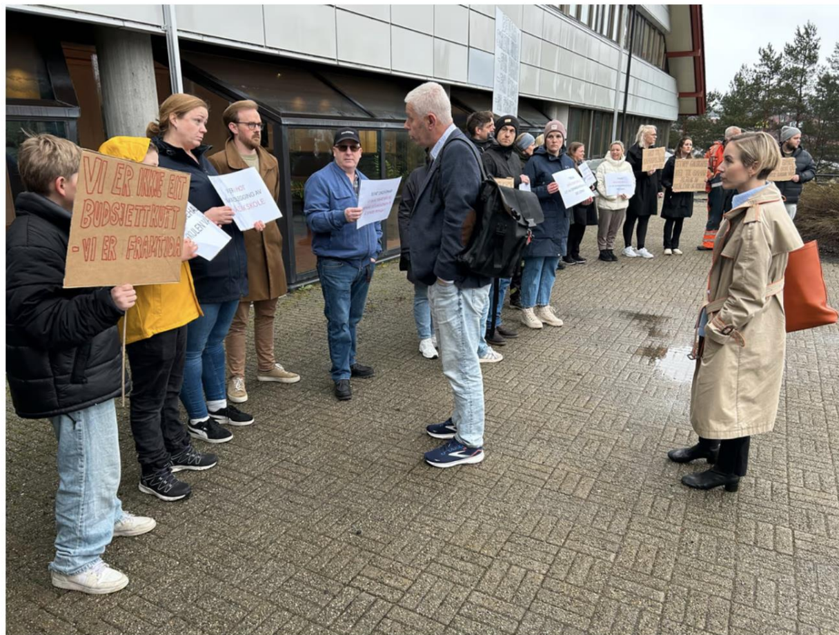
Demonstrantane som møtte opp ved starten av kommunestyremøtet protesterte mot kutt i mellom anna skule. På det området vart dei i liten grad høyr.

Dei tenestene politikarane skjermar frå kutt, gjeld i hovudsak eldre, helse og velferd.