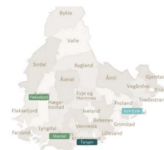
Figur 25 Illustrasjon av hvilke skoler som tilbyr RM.