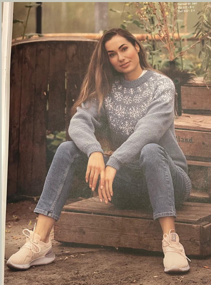
Genser str liten Blå 522 - 8 m Hvit 500 - 2 m