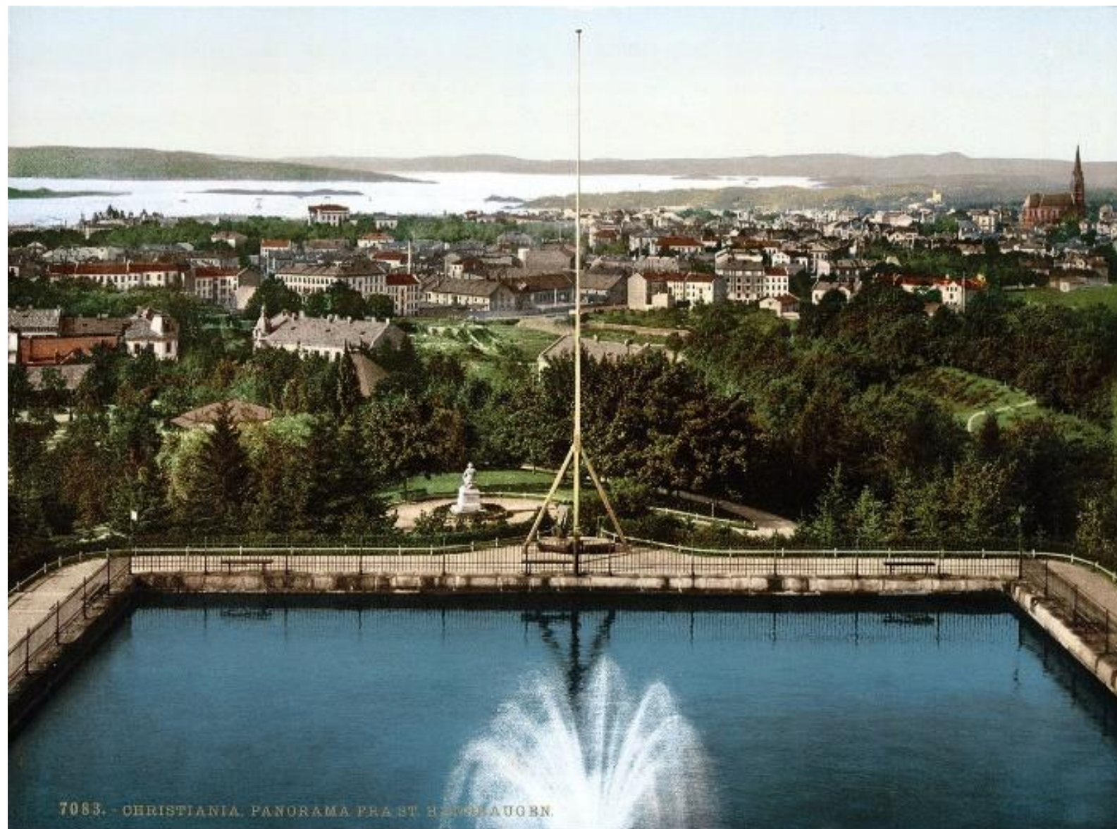
7083. - CHRISTIANIA. PANORAMA FRA ST. HANSHAUGEN.