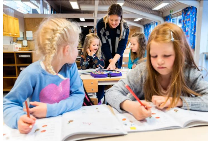
LAGET RUNDT ELEVENE: Laget rundt elevene består ikke bare av lærere, minner de andre yrkesgruppene i skolen om.