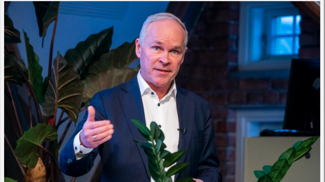
Utdanningspolitisk talsmann Jan Tore Sanner i Høyre.