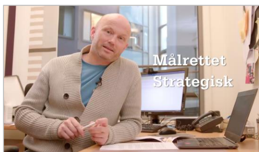
Fra filmen om å jobbe strategisk