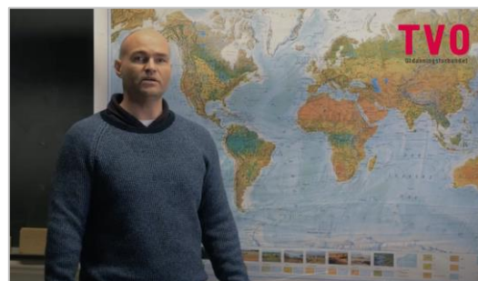
Fra filmen om arbeid internasjonalt