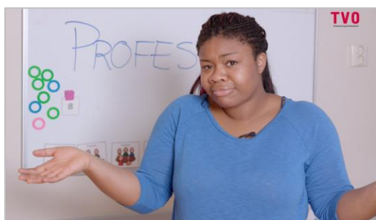
Fra filmen om profesjon

Vi vil vise tre filmer i dette kurset, en om profesjon, en om Utdanningsforbundets arbeid internasjonalt og en om hvordan jobbe strategisk i klubben. Filmene er tilgjengelig for dere etter kurset på nett sidene for tillitsvalgtopplæringen.