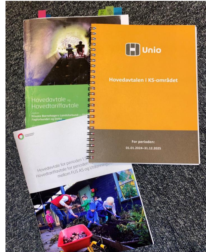
Eit utval av tariffavtaler

Du har, som ATV, rett til å ha tid til å utføre vervet ditt.